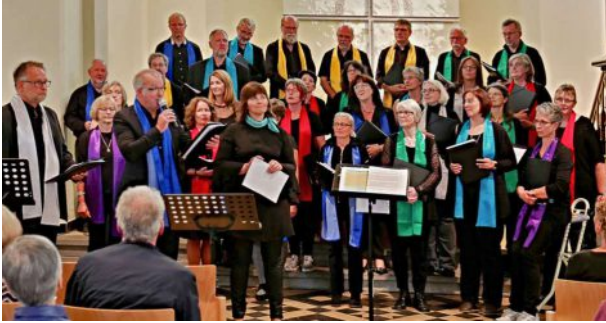
Good News Chor